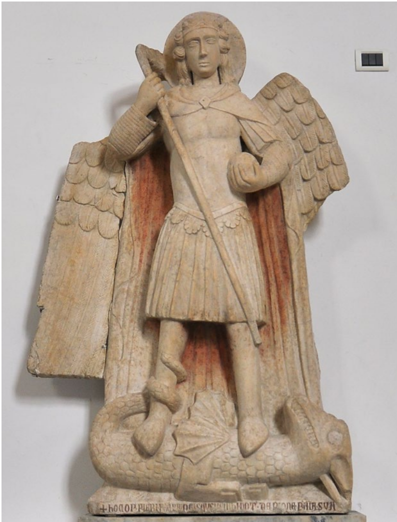
Fig. 4. Statua di San Michele.

rigida – la statua ricorda piuttosto le opere del Trecento, come la statua dell'arcangelo Michele e il busto di Cristo del portone dell'Ospedale dell'Angelo del 1348. 22 È inoltre plausibile che l'ospedale sia stato dotato di una raffigurazione del suo santo patrono poco dopo la sua fondazione o in occasione del giubileo 1350. In assenza di ulteriori documenti, tuttavia, la questione della datazione e dell'attribuzione rimane aperta.