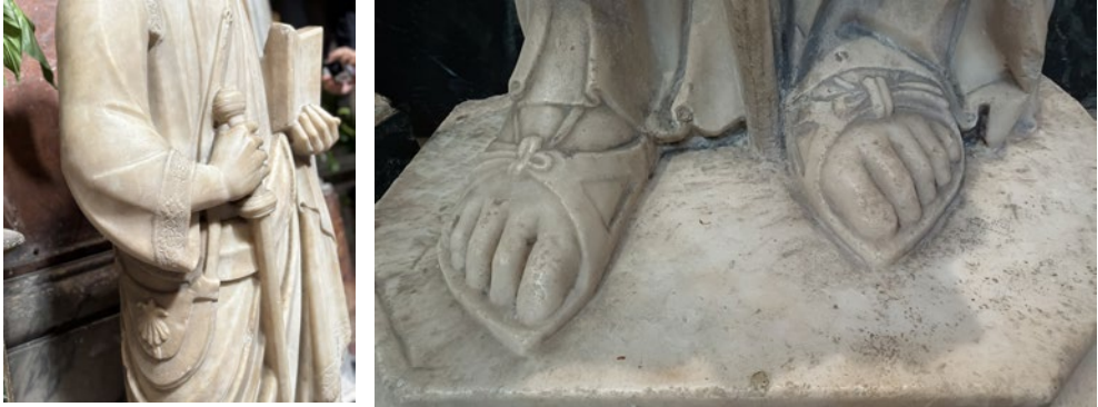
Fig. 1. Attributi di San Giacomo apostolo e pellegrino.

La statua, in marmo e a grandezza naturale (alta 1,74 inclusa la sua base di 9 cm), è identificata come San Giacomo maggiore dal suo abito da pellegrino: il bastone che tiene nella mano destra e soprattutto la borsa contrassegnata dalla conchiglia sono un chiaro riferimento al pellegrinaggio a Santiago da Compostella. Nella mano sinistra regge un libro aperto, anch'esso uno dei suoi attributi tradizionali 1 . Indossa i sandali, le calzature degli apostoli, che sono realizzati con una straordinaria cura dei dettagli, tanto da evocare la scultura antica, pur senza derivare da un modello specifico 2 . Dal punto di vista tipologico, egli presenta tratti affini all'iconografia di Cristo, caratteristica che si ritrova anche in altre raffigurazioni dell'apostolo 3 . Sopra la veste decorata con bordure indossa