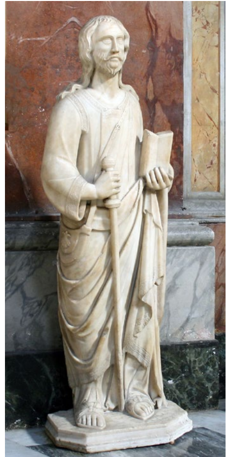
Fig. 2. La statua di San Giacomo ad Augusta.

Da tali provvedimenti si può dedurre che all'epoca le condizioni del complesso fossero molto precarie: si potrebbe supporre che la riorganizzazione fosse stata una reazione all'enorme afflusso di pellegrini giunti per il giubileo del 1450, anno segnato da un grave incidente a ponte Sant'Angelo – con tanti morti e feriti – e dalla peste, due eventi che avevano messo in evidenza la necessità di